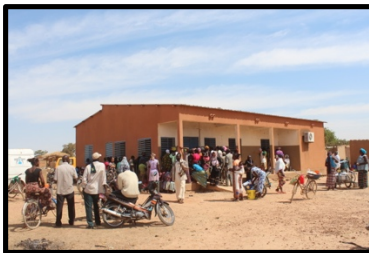
Lugar de trabajo