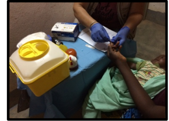
Test rápido de malaria