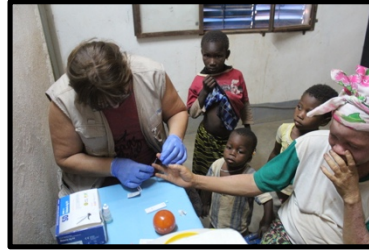
Test y Tratamiento de malaria