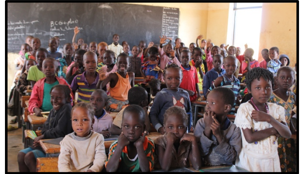
Formación en higiene básica y prevención de la malaria en la escuela de Yagma