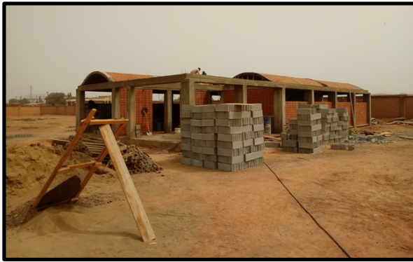
Colocación de los BTC en el techo