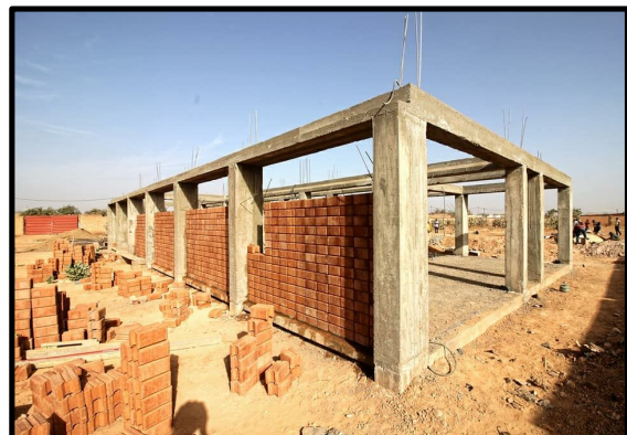
Colocación de los BTC