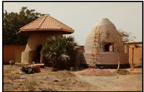
Domo Central y dormitorio