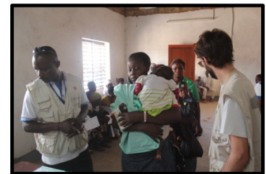
Triaje de pacientes