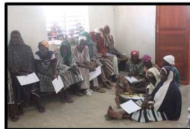
Sala de espera