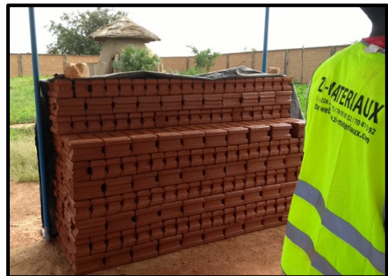
Bloques de tierra comprimida (BTC)