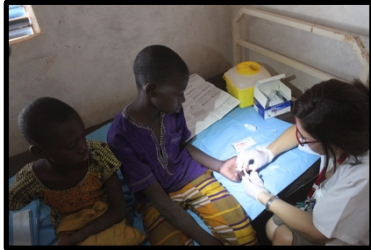
Test y Tratamiento de malaria