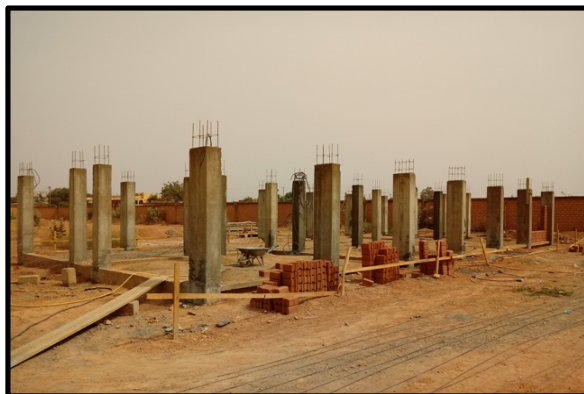
Pilares del edificio