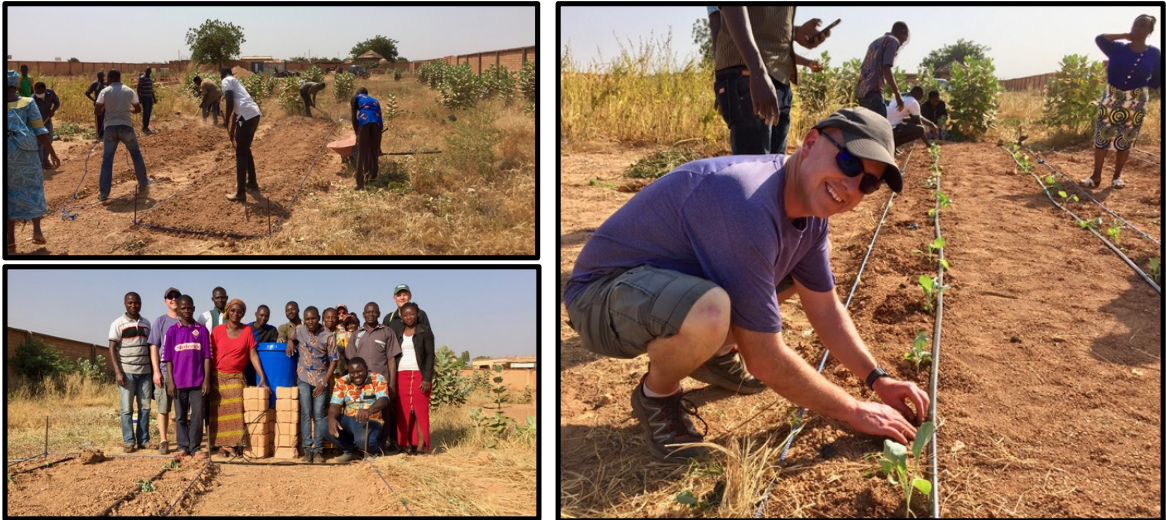
Formación a burkinabeses en la implementación del riego por goteo