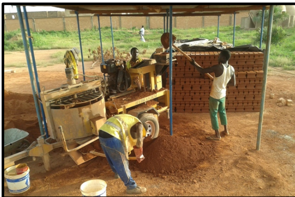
Máquina de producción de BTC