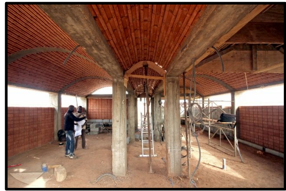
Detalle del techo en forma de arco