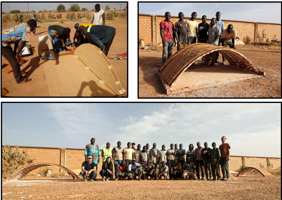
Formación a burkinabeses en Bóvedas de ladrillo Plano Esta formación se ha implementado en la construcción del bloque médico-quirúrgico