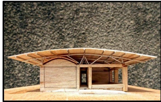
Maqueta del edificio